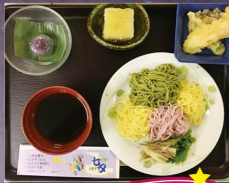
エクセルシオール西国分寺