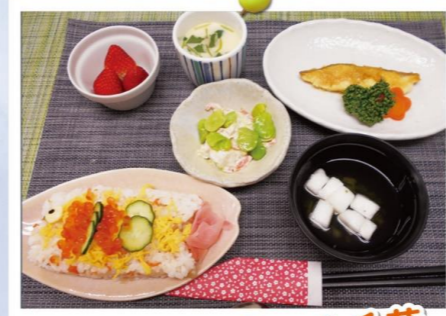
エクセルシオール千葉