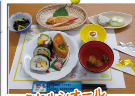
エクセルシオール 稲毛海岸