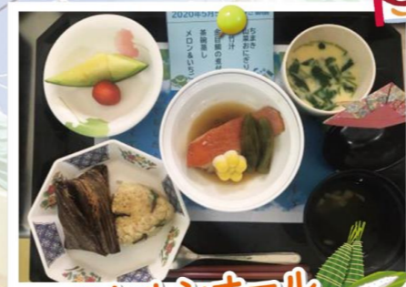
エクセルシオール 八千代台