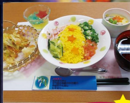
エクセルシオール稲毛海岸