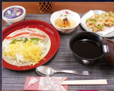
エクセルシオール千葉