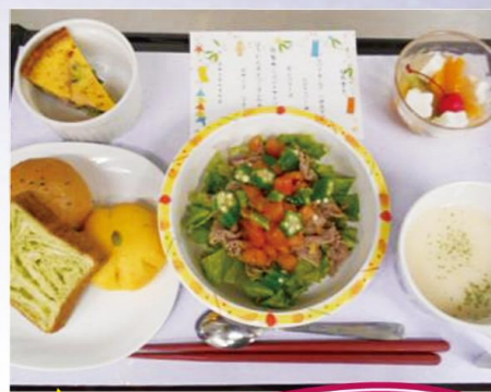
エクセルシオール湘南台