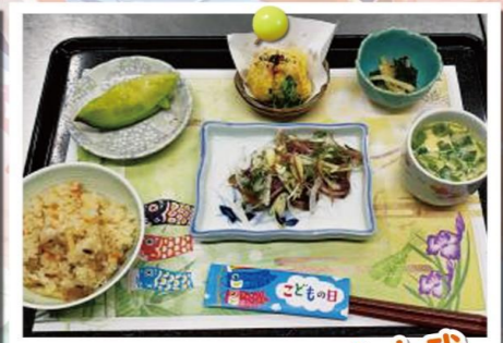
エクセルシオール山武