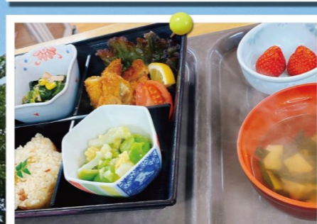
エクセルシオール秦野