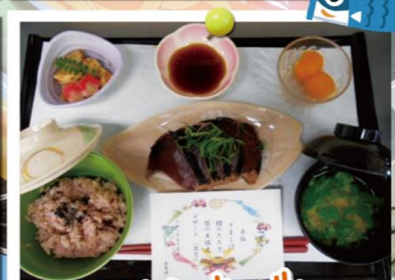
エクセルシオール 湘南台