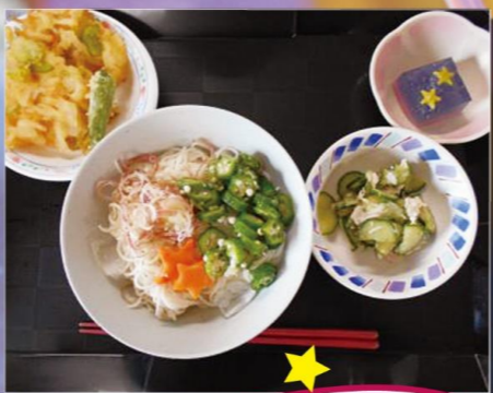
エクセルシオール横浜坂東橋