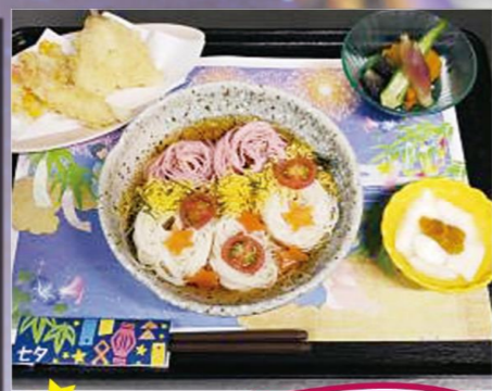
エクセルシオール山武