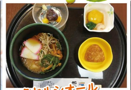
エクセルシオール 西国分寺