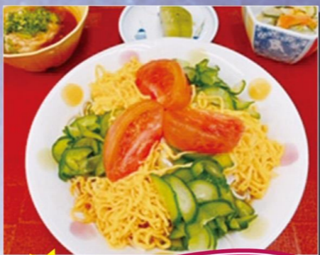
エクセルシオール秦野