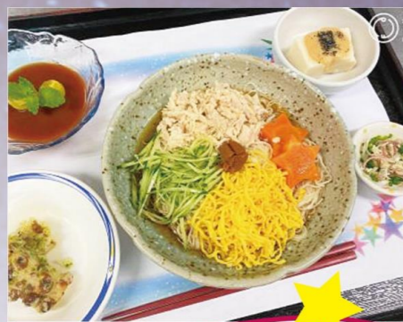
リッチランド豊南郷