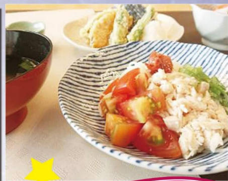
エクセルシオール佐原