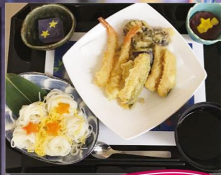
エクセルシオール八千代台