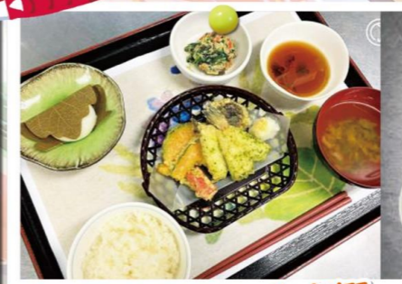
リッチランド豊南郷