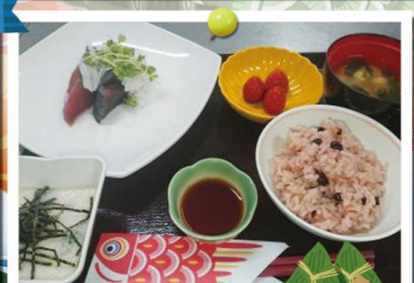
エクセルシオール佐原